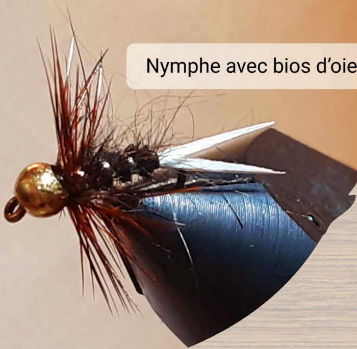
Nymphe avec bios d'oie